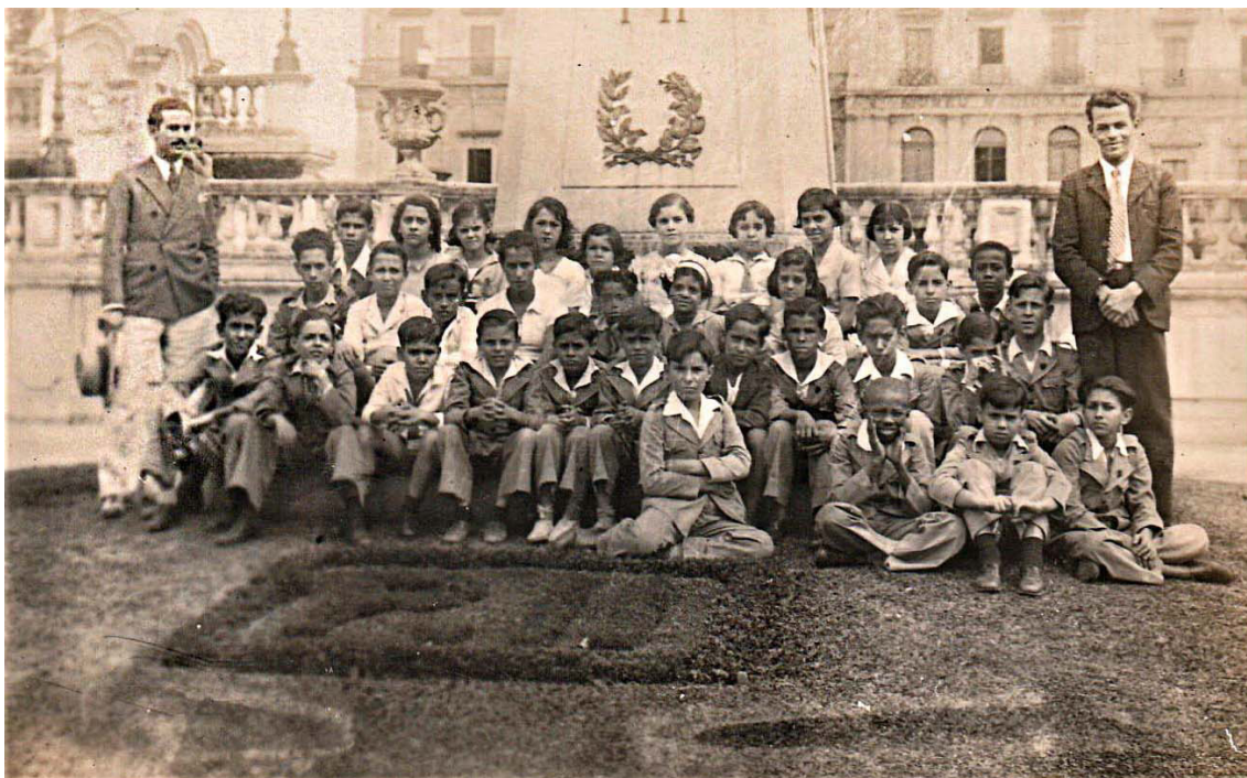
Figura 2. Postal de alunos em visita ao Museu Nacional, década de 1920.