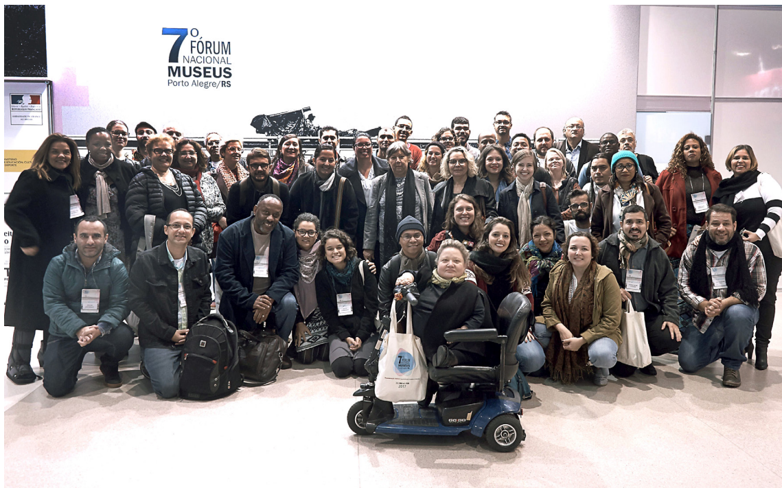
Figura 4. Participantes do II Encontro Nacional do Programa Nacional de Educação Museal, PUC-RS, Porto Alegre, 2017.

O protagonismo das REM nesse contexto é também fato relevante e levou ao reconhecimento das redes pelo poder público e à ocupação de importantes espaços, como o Caderno e o site da Pnem, além da publicação de documentos fundamentais para o desenvolvimento desse processo, como é o caso da Carta de Petrópolis (2010), Carta de Belém (2014) e Carta de Porto Alegre (2017), instrumentos essenciais na luta pela publicação da Pnem.