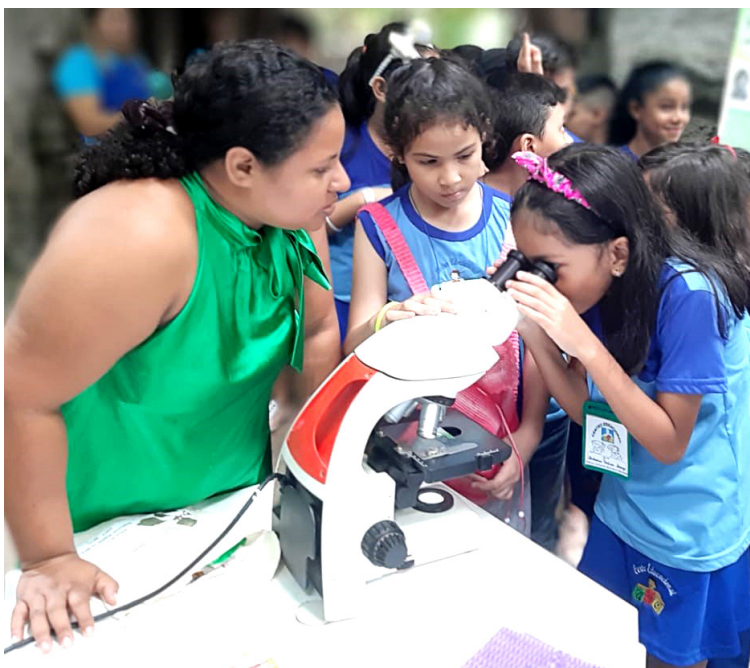
Imagem 2 – Apresentação do Laboratório de Anatomia Vegetal - LAVeG, no Parque Zoobotânico, em que a pesquisadora demonstra por microscópio, o micromundo das plantas – isto é, conhecer os diferentes tecidos e células que formam o corpo vegetal.