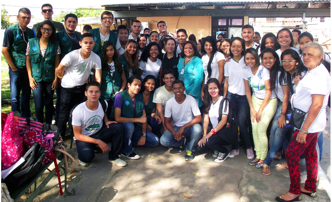
Imagem 1 – na entrada do Campus de Pesquisa do Museu Goeldi, no bairro da Terra Firme, os mediadores que irão receber o público na versão de 2014.

As imagens a seguir demonstram uma breve apresentação do número de pessoas envolvidas no Portas Abertas, como também uma representação de uma das áreas de pesquisa, a Botânica, atendendo ao público participante.