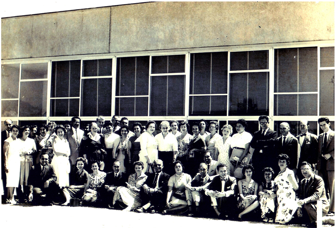
Figura 3. Participantes do Seminário Regional da UNESCO sobre a Função Educativa dos Museus, 1958, Museu de Arte Moderna, Rio de Janeiro.